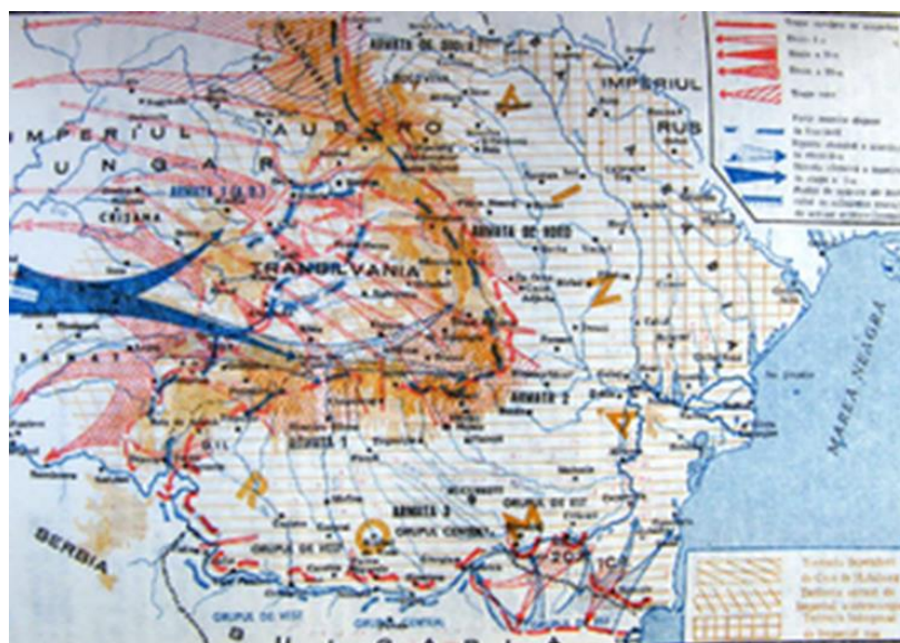
Planul de campanie al armatei României pentru anul 1916 - „Ipoteza Z” 12

Armata 2 , comandată de generalul Alexandru Averescu, concentrată pe frontiera de nord a Munteniei, trebuia să treacă la ofensivă în fâșia cuprinsă între valea Oituzului și cursul superior al râului Argeș și să iasă pe râul Mureș între Târgu Mureș și Alba Iulia, ulterior să continue ofensiva prin Poarta Someșului.