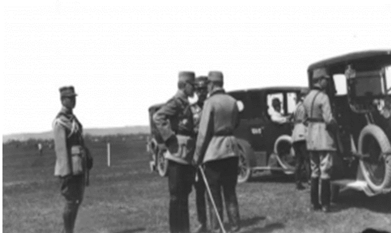
Constantin Prezan și regele Ferdinand pe front, în 1917

Începuturile cariere sale militare își au rădăcinile încă din timpul liceului, la Școala Fiilor de Militari din Iași. Urmează, după absolvirea liceului, Școala Militară de Infanterie și Cavalerie, unde se specializează în arma geniu. La doar două luni de la absolvirea școlii merge la București și urmează cursurile Școlii speciale de artilerie și geniu 13 , între anii 1881-1883. În același an 1883, pleacă în Franța, la Fontainebleau, la prestigioasa Școală de Aplicație pentru Artilerie și Geniu, cursuri pe care le absolvă, după trei ani, cu aprecierea „prea bine” 14 .