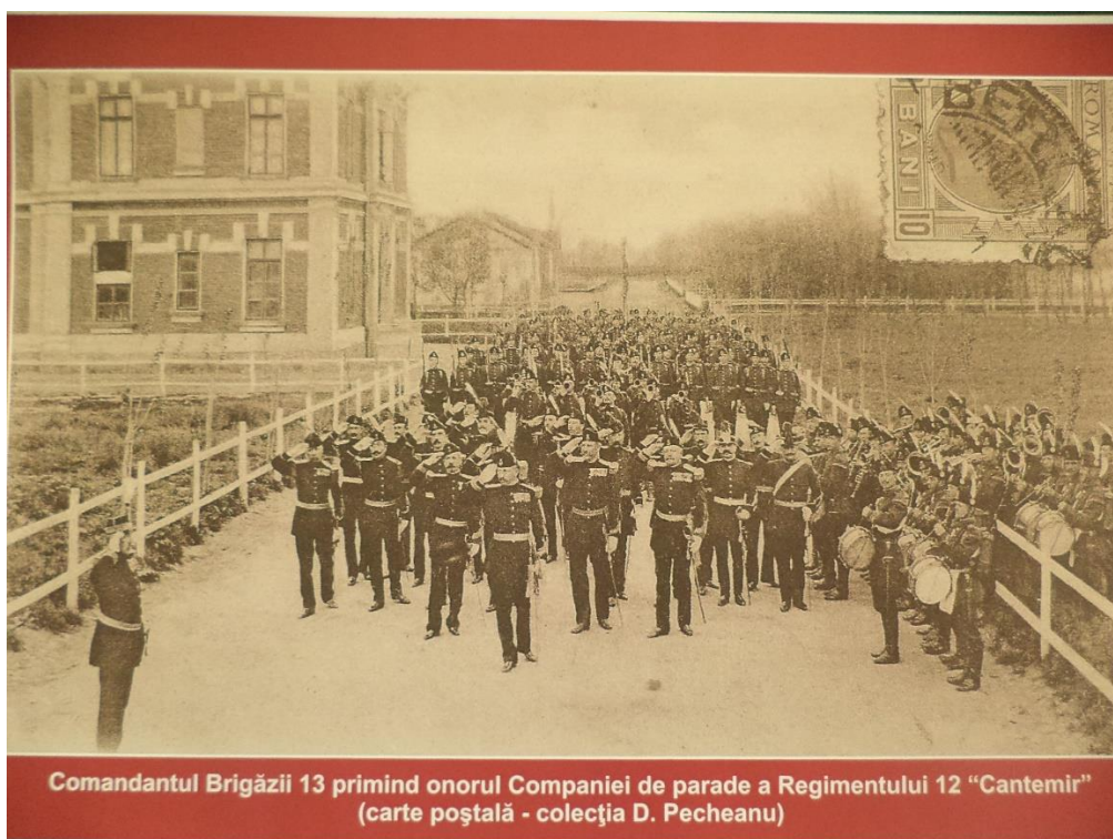
Comandantul Brigăzii 13 primind onorul Companiei de parade a Regimentului 12 "Cantemir" (carte poștală - colecția D. Pecheanu)

șarjă de la Prunaru precum și cele ale soldaților Regimentului 12 Dorobanți „Dimitrie Cantemir” care au luptat la Topraisar, Cobadin, Turtucaia, Mărăști și Oituz.